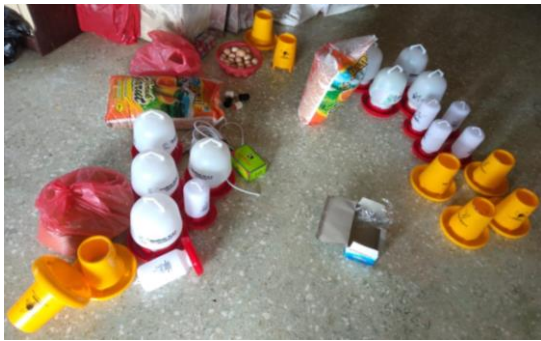
Gambar 5. Peralatan pendukung beternak