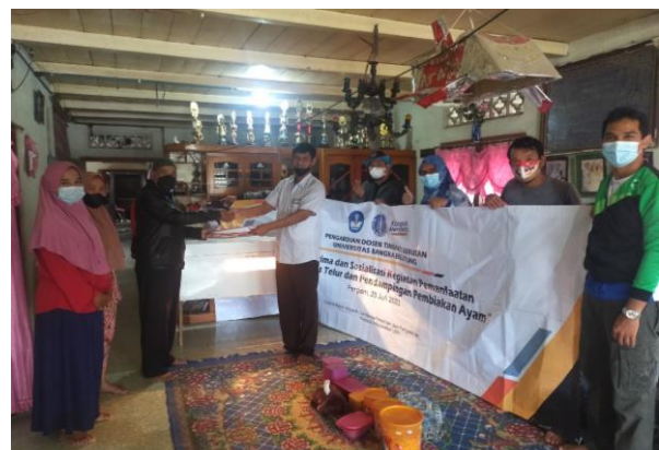
Gambar 4. Serah terima mesin tetas telur