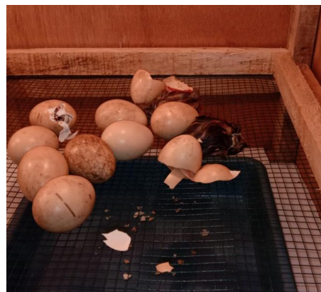
Gambar 6. Telur ayam yang telah menetas dalam mesin tetas telur

Mitra pengabdian sangat antusias dalam pelaksanaan kegiatan ini. Mereka mengharapkan dilakukan pendampingan secara berkelanjutan agar kegiatan beternak ayam maju sehingga dapat membantu perekonomian keluarganya.