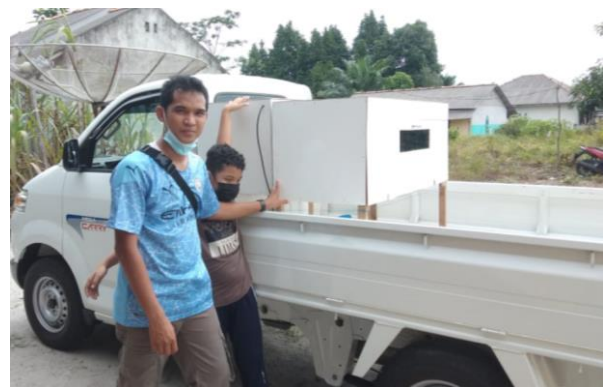
Gambar 3. Pengantaran Mesin Tetas ke Mitra PkM

Penyerahan mesin tetas telur ditujukan langsung ke dua mitra PkM. Kegiatan penyerahan dihadiri oleh ketua mitra 1 dan ketua mitra 2 PMTJ beserta anggotanya, dari pihak desa Pergam dihadiri langsung oleh Kepala Desa dan Jajarannya, dan Tim PkM Dosen dari Jurusan Teknik Mesin UBB. Selain penyerahan mesin tetas telur, juga diserahkan peralatan penunjang untuk beternak seperti tempat minum ayam, tempat makan ayam, bibit ayam, pakan ayam, peralatan penerangan kandang, telur yang fertil, dan vitamin ayam.