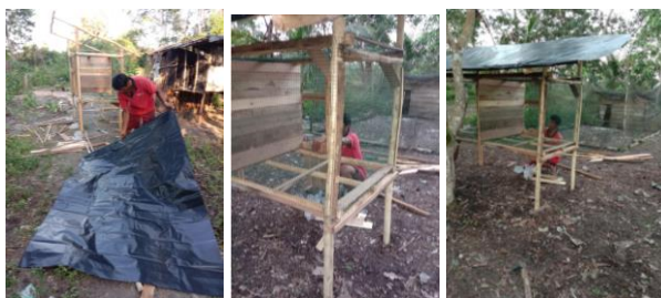
Gambar 5. Pembuatan Kandang

Tim PkM juga memberikan bantuan untuk perbaikan dan pembuatan kandang ayam. Perbaikan kandang dilakukan oleh mitra PkM. Selain itu juga dilakukan pembuatan kandang baru oleh mitra.