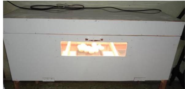
Gambar 2. Mesin Tetas Telur