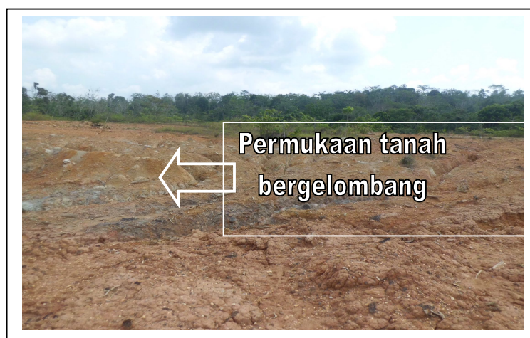
Gambar 2. Kondisi permukaan tanah timbunan pada lahan bekas tambang Pit-2 PT AMI