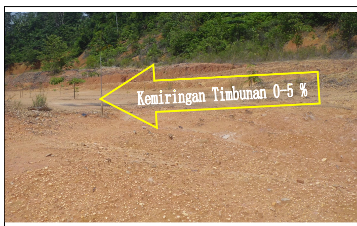
Gambar 4. Kemiringan tanah timbunan lubang bekas tambang PT AMI