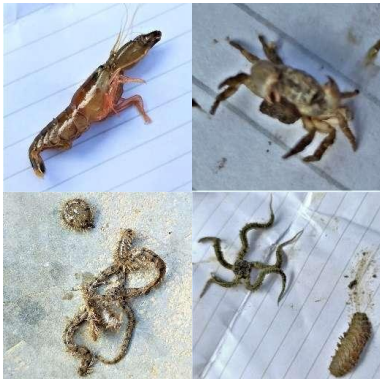
Gambar 3. Hewan-hewan yang ada pada terumbu karang P. lobata

Pada terumbu karang P. lobata ini terdapat beberapa hewan seperti udang, kepiting, bintang ular, dan cacing laut. Hal ini menandakan bahwa kondisi karang ini masih bagus sehingga digunakan sebagai tempat berlindung. Namun memang terumbu karang di Pulau Nangka ini dapat ditemukan pada daerah yang selalu tergenang oleh air, karena tidak ditemukan sama sekali adanya terumbu karang pada zona intertidal. Hal ini dikarenakan terumbu karang jenis Porites lebih rentan terhadap pemanasan laut, penyakit, dan kenaikan keasaman laut.