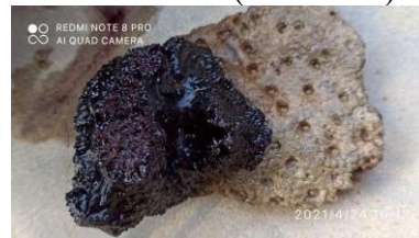
Gambar 4. Karang P. lobata yang ditumbuhi alga

Gangguan kesehatan dari genus Porites di Perairan Pulau Nangka ini berupa sedimentasi dan pertumbuhan alga kompetitor (Mellani et al. , 2019). Sedimentasi diperkirakan merupakan salah satu dampak dari keruhnya perairan di Pulau Nangka. Selain itu lokasinya yang lebih dekat dengan daratan juga dapat menjadi faktor yang menyebabkan terjadinya sedimentasi. Sedangkan gangguan dari alga kompetitor belum terlalu parah, karena alga yang tumbuh di atas jaringan karang ( P. lobata ) belum terlalu berlebihan (Gambar 4).