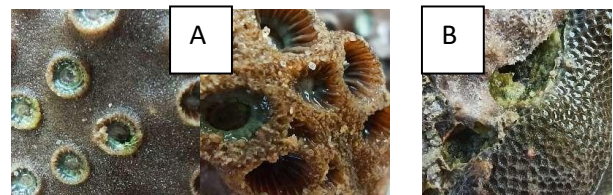
Gambar 2. Perbandingan koralit kedua terumbu karang (A) P. napopora dan (B) P. lobata

Porites lobata , yaitu memiliki warna coklat keabu-abuan dengan ciri koloni massive berukuran besar dengan permukaan relatif kasar dengan koralit relatif besar. Koralit mempunyai kolumela dengan septa mempunyai dua tentakel. Seperti triplet tidak bersatu. Spesies ini memiliki kemiripan dengan spesies Porites lutea yang berbentuk kubah besar dengan warna coklat muda atau tua dan memiliki permukaan koloni yang terkesan lebih halus dibandingkan permukaan P. lobata .