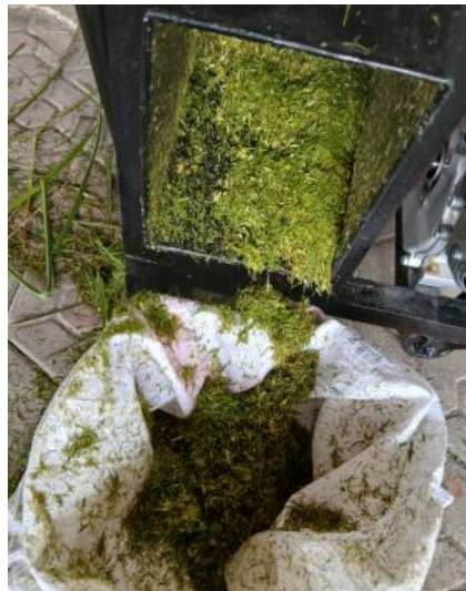
Gambar 6. Hail ujicoba mesin