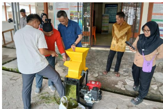
Gambar 5. Ujicoba mesin bersama mitra

Selain itu mesin pencacah juga diujicoba oleh mitra pengabdian (lihat gambar 5). Tujuannya adalah untuk emlatih mitra dalam penggunaan mesin pencacah sehingga nanti dapat menggunakan secara mandiri.