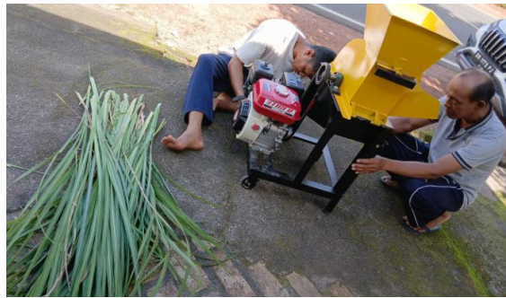
Gambar 4. Persiapan ujicoba mesin

Sebelum diserahkan ke mitra, mesin diujicoba terlebih dahulu oleh tim pengabdian (lihat Gambar 4)