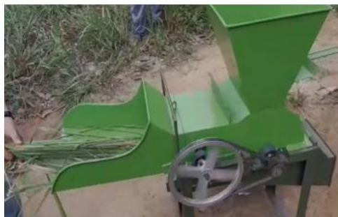
Gambar 1. Rencana mesin pencacah