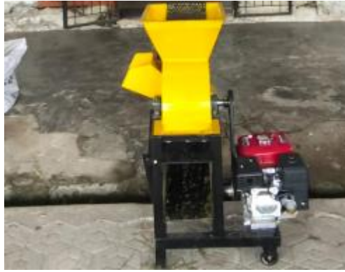
Gambar 3. Mesin pencacah

Sebelum diserahkan ke mitra, mesin diujicoba terlebih dahulu oleh tim pengabdian (lihat Gambar 4)