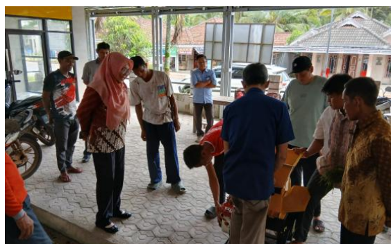
Gambar 8. Demontrasi penggunaan mesin

Setelah penyerahan mesin, selanjutnya demontrasi dan sosialisasi penggunaan mesin pencacah oleh tim pengabdian kepada mitra PMTJ (lihat Gambar 8)