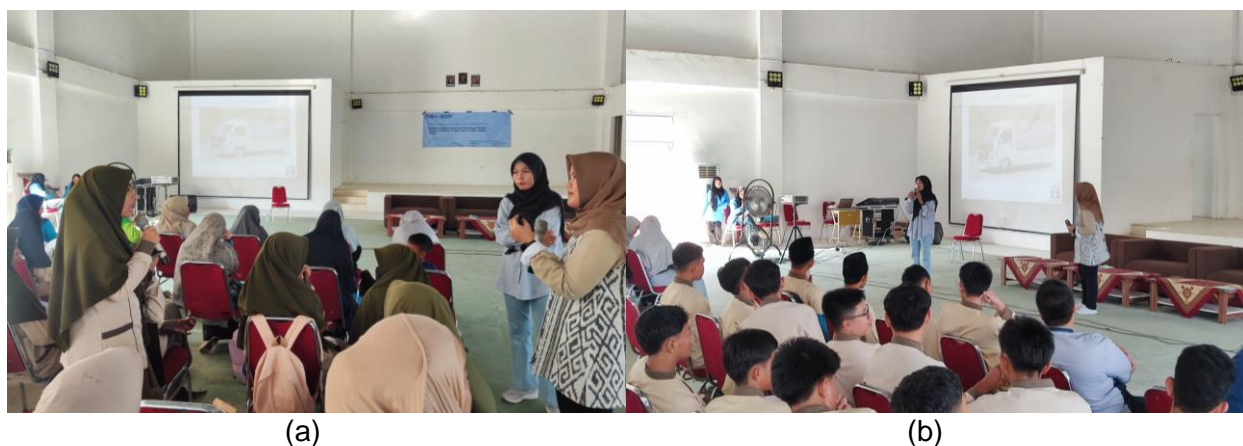
Gambar 3. Diskusi dan pembahasan studi kasus terkait kendala-kendala selama penyusunan KTI

Selama penyampaian materi baik siswa maupun guru sangat antusias dengan materi yang disampaikan. Sesi diskusi dan tanya jawab yang dilakukan berlangsung sangat baik dengan pertanyaan yang sangat beragam, tidak hanya terkait penulisan KTI secara sistematis tetap bahkan banyak studi kasus yang pada akhirnya dibahas bersama antara peserta dan pemateri (gambar 3). Terdapat pesertan yang pernah mengikuti lomba KTI tingkat nasional yang masih menghadapi berbagai kendala terkait pemilihan judul dan relevansinya terhadap tema, pemilihan metode yang mumpuni dan memfasilitasi tujuan yang ingin dicapai serta kedalaman analisis data. Diskusi yang dilakukan membuka wawasan baru bahwa penulisan KTI mengharuskan kita untuk mencermati permasalahan dari berbagai sudut pandang agar dapat memberikan informasi yang sistematis, detail, mumpuni dan komunikatif. Sudut pandang penulis dalam penulisan KTI menjadi salah satu faktor yang sangat berpengaruh dalam alur yang ingin disampaikan kepada pembaca.