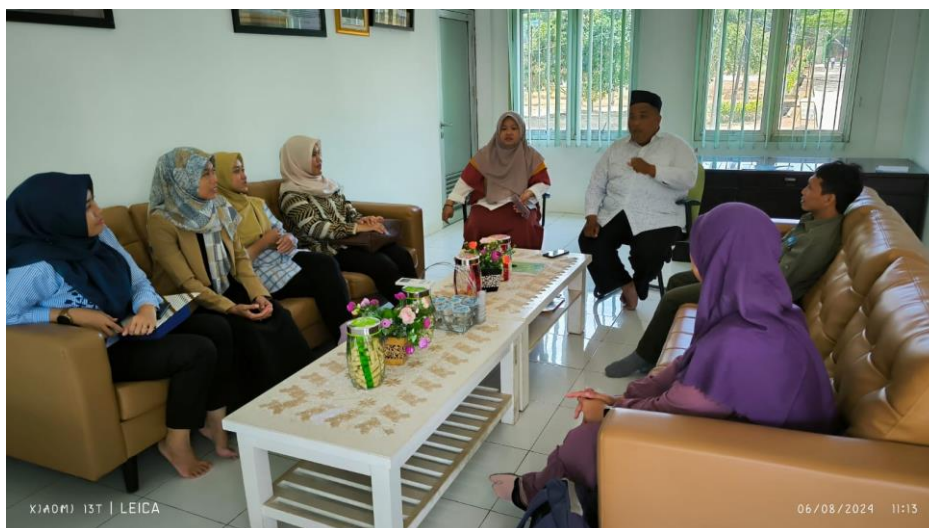
Gambar 1. Koordinasi dengan pihak MAN Insan Cendikia

Tulisan yang baik adalah tulisan yang komunikatif, yaitu pesan yang disampaikan dapat dipahami oleh pembaca sesuai dengan apa yang dimaksud oleh penulis. Tulisan yang komunikatif menggunakan bahasa yang tersusun secara sistematis, mudah dimengerti, tidak berbelit-belit, dan bebas dari makna ganda (ambigu). Karya tulis ilmiah yang berkualitas tidak hanya mampu menyajikan ide-ide inovatif, tetapi juga memberikan solusi konkret terhadap permasalahan yang dihadapi oleh masyarakat [6]. Melalui pelatihan KTI ini diharapkan peserta dapat mengimplementasikan bagaimana membuat suatu KTI yang bisa menjadi jembatan komunikasi yang baik antara di penulias dan pembaca.