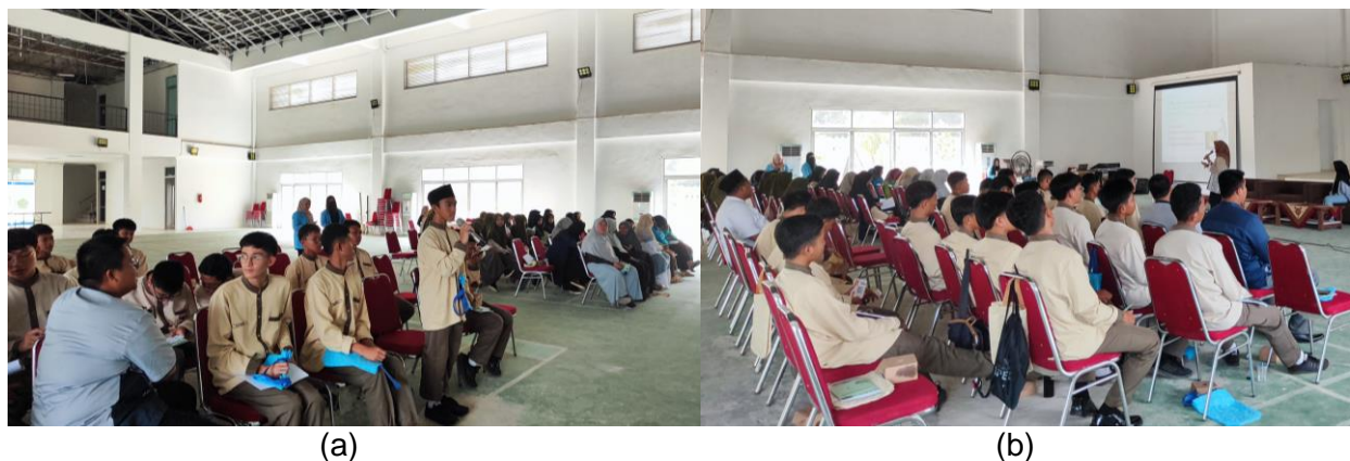
Gambar 2. (a) tanya jawab singkat sebelum materi, (b) penyampaian materi

Selama penyampaian materi baik siswa maupun guru sangat antusias dengan materi yang disampaikan. Sesi diskusi dan tanya jawab yang dilakukan berlangsung sangat baik dengan pertanyaan yang sangat beragam, tidak hanya terkait penulisan KTI secara sistematis tetap bahkan banyak studi kasus yang pada akhirnya dibahas bersama antara peserta dan pemateri (gambar 3). Terdapat pesertan yang pernah mengikuti lomba KTI tingkat nasional yang masih menghadapi berbagai kendala terkait pemilihan judul dan relevansinya terhadap tema, pemilihan metode yang mumpuni dan memfasilitasi tujuan yang ingin dicapai serta kedalaman analisis data. Diskusi yang dilakukan membuka wawasan baru bahwa penulisan KTI mengharuskan kita untuk mencermati permasalahan dari berbagai sudut pandang agar dapat memberikan informasi yang sistematis, detail, mumpuni dan komunikatif. Sudut pandang penulis dalam penulisan KTI menjadi salah satu faktor yang sangat berpengaruh dalam alur yang ingin disampaikan kepada pembaca.