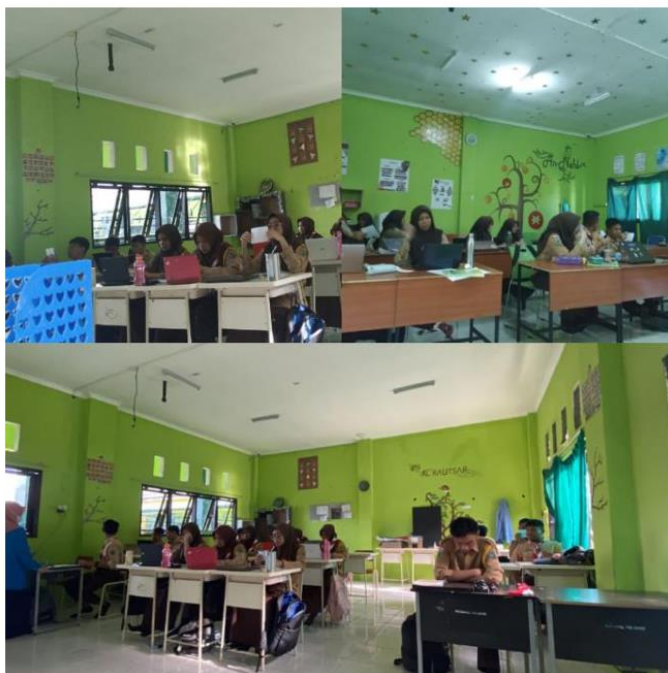
Gambar 1. Kegiatan literasi bacaan di dalam kelas