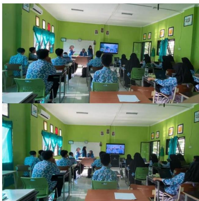
Gambar 2. Kegiatan literasi menonton video