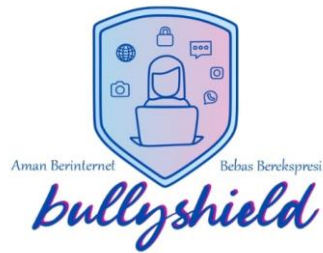
Gambar 16. Logo bullyshield (2024)