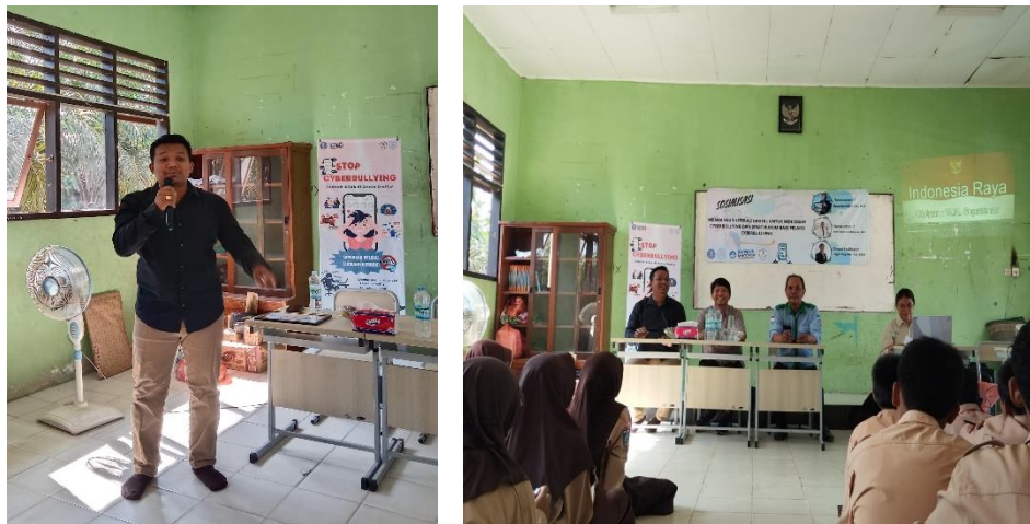
Gambar 13. Pengisian materi Jerat hukum.