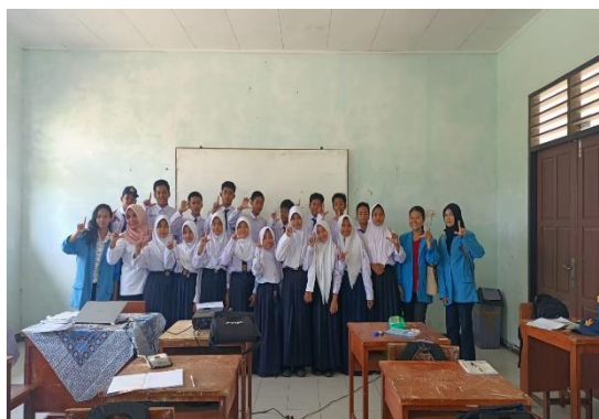
Gambar 5. Foto Bersama pasca proses belajar mengajar.