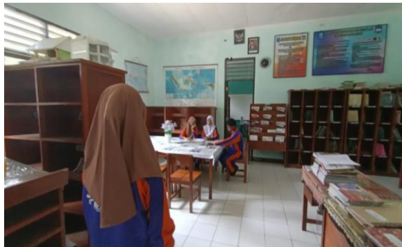
Gambar 7. Proses pengambilan video drama.