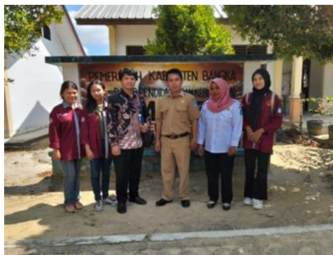
Gambar 1. Survei Lokasi dan pengantar mahasiswa fasilitator.