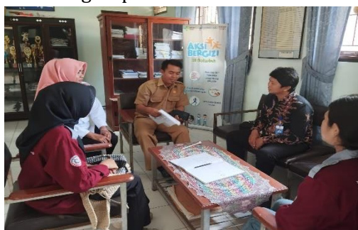
Gambar 2. Pengenalan kegiatan