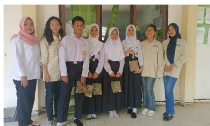
Gambar 8. Penerimaan bingkisan.