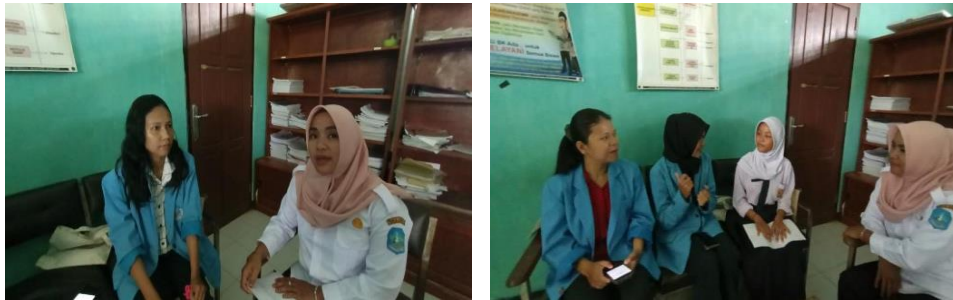
Gambar 6. Wawancara dengan Guru BK dan siswi kelas IX.

cyberbullying ini terjadi di luar jam sekolah, serta cara mengatasi jika terdapat siswa/siswi yang takut untuk melaporkan cyberbullying yang ia alami. Kemudian kami juga melakukan wawancara pada salah satu siswi mengenai pemahaman seputar cyberbullying dan pengalaman yang ia alami.