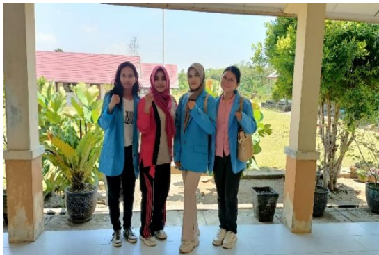
Gambar 9. Pasca dikusi dengan guru BK.