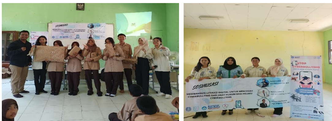
Gambar 14. Pembagian doorprize dan penutupan kegiatan sosialisasi.

Dari persiapan sosialisasi, adapun website yang kami rancang dan kami serahkan kepada pihak sekolah untuk dimanfaatkan sebaik mungkin. Website yang kami buat di beri nama bullyshield dimana website ini diharapkan dapat memberikan perlindungan dari perundungan. Bullyshield mudah di akses dan menawarkan beberapa informasi serta layanan pengaduan. Adanya Website ini untuk meningkatkan minat literasi siswa-siswi untuk memahami terkait pemahaman cyberbullying sehingga dapat mencegah dan mengatasi jika terjadi pada diri sendiri.