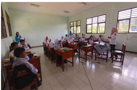
Gambar 4. Pengamatan proses belajar mengajar.