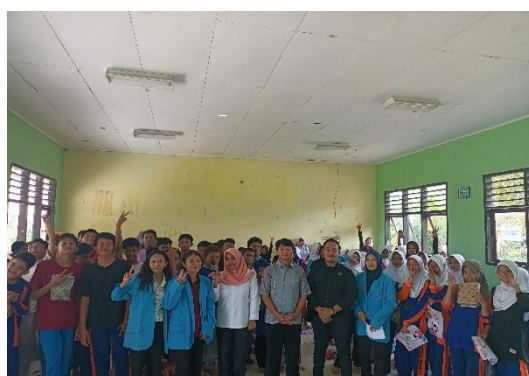
Gambar 10. Sesi foto bersama sekaligus pembukaan sosialisasi hari pertama.