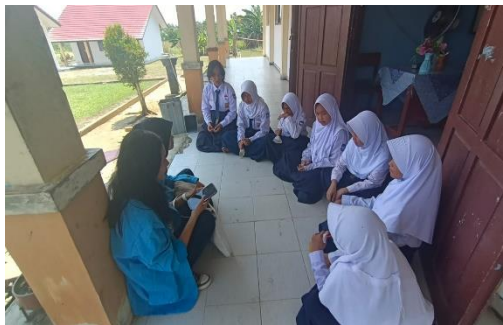
Gambar 3. Pengamatan bentuk-bentuk dan potensi cyberbullying.