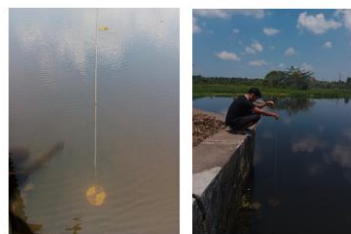
Gambar 4. (a);(b) lingkungan sekitar pengamatan perairan embung bumang

Perairan embung bumang menjadi titik awal pengukuran diminggu pertama dibulan September pada tanggal 2 september 2025. dapat diketahui bahwa kondisi fisik air pada parameter tingkat kekeruhan, air sungai jernih dan dikelilingi oleh enceng gondok, yang dapat mempengaruhi penurunan kualitas air.