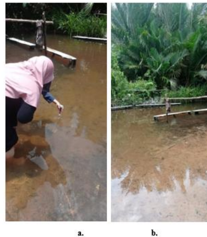
Gambar 3. (a);(b) lingkungan sekitar pengamatan perairan air duren.

Perairan air duren menjadi titik awal pengukuran diminggu pertama dibulan September pada tanggal 2 september 2025. dapat diketahui bahwa kondisi fisik air pada parameter tingkat kekeruhan, air sungai jernih dan dikelilingi oleh pepohonan.