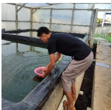
Gambar 8. Pemberian Pakan pada Benih Ikan Lele Sangkuriang

Sumber: BBP BAT Sukabumi ( Tubifex sp.) dan (PF 100)