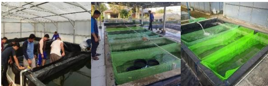
Gambar 6. Pemanenan dan Pemasangan Happa Penampungan Pendederan