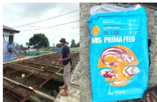
Gambar 1. Pemberian dan Jenis Pakan Indukan

Pemberian pakan induk selama pemeliharaan induk Ikan Lele Sangkuriang diberi pakan berupa pelet tenggelam berukuran 7 mm dengan merek dagang PF128 (Gambar 1) dengan kandungan gizi dapat dilihat pada Tabel 1. Metode pemberian pakan dilakukan dengan cara ditebar secara merata pada kolam pemeliharaan induk dan dengan frekuensi pemberian pakan sebanyak 2 kali sehari yaitu pada pagi hari pukul 08.00-09.00 WIB dan pada sore hari pukul 15.00-16.00 WIB (Gambar 1). Adapun Feeding Rate (FR) yang digunakan yaitu sebesar 1% dari biomassa.