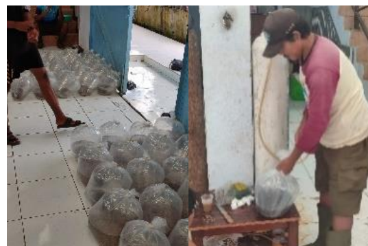
Gambar 7. Proses Pengepakan (Packing)

berjumlah \pm 30.000 ekor. dari sisa tersebut di tebar kembali kesana (tempat pemeliharaan benih) untuk melakukan pendederan kedua.