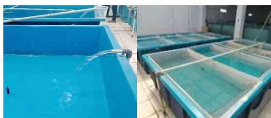
Gambar 4. Persiapan Wadah Penetasan

Wadah penetasan yang akan digunakan sudah dibersihkan dalam 1 minggu sebelum dilakukannya pemijahan. wadah dilakukan pengisian air sebanyak 3.200 liter dengan ketinggian air mencapai 40 cm dengan bak ukuran 4x2 meter. Penetasan telur biasanya dilakukan didalam bak fiber. Telur akan menetas selama 1-2 hari setelah proses stripping (Mutalib & Tunggul, 2020). Lalu diberi aerasi kuat sebanyak 4 titik/bak. Wadah yang telah diisi air kemudian dipasang hapa sebanyak 4 hapa untuk 1 bak pemeliharaan, ukuran hapa yang digunakan yaitu 1 m x 2 m x 0,5 m.