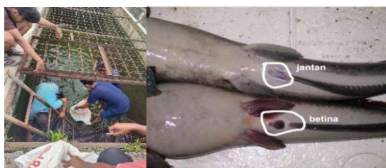
Gambar 2. Seleksi Induk Ikan Lele Sangkuriang

Seleksi induk dilakukan untuk memilih indukan yang telah siap untuk dipijahkan. Proses seleksi dilakukan pada pagi hari sekitar pukul 08.00-10.00 WIB. Langkah awal yang dilakukan yaitu menyurutkan air media pemeliharaan bak induk agar memudahkan ketika proses seleksi berlangsung. Kemudian induk jantan dan betina yang telah matang gonad diambil dan dimasukkan ke dalam karung yang berbeda antara induk jantan dan betina lalu, dilakukan penimbangan menggunakan timbangan gantung. Tujuan utama dilakukannya seleksi indukan adalah untuk mengetahui kematangan gonad dan indukan yang dipilih harus benar-benar yang unggul (Darseno, 2010).