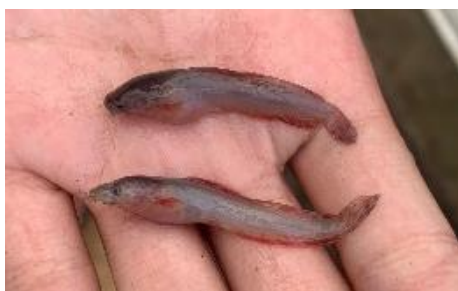
Gambar 9. Benih Ikan yang Terserang Penyakit Motile Aeromonas Septicaemia (MAS)

Penyakit yang terjadi pada Ikan Lele Sangkuriang ( Clarias gariepinus ) yang ada di Balai Besar Perikanan Budidaya Air Tawar yaitu Motile Aeromonas Septicaemia (MAS), atau sering dikenal dengan istilah penyakit bercak merah yang disebabkan oleh bakteri Aeromonas hydrophila . Gejala klinis penyakit bercak merah yaitu berubahnya warna kulit menjadi gelap, timbul pendarahan yang selanjutnya akan menjadi borok ( hemorrhagic ) diikuti oleh luka-luka dan borok pada kulit yang meluas ke jaringan otot, rongga mulut, sirip dan di bagian insang sehingga ikan sulit bernapas.