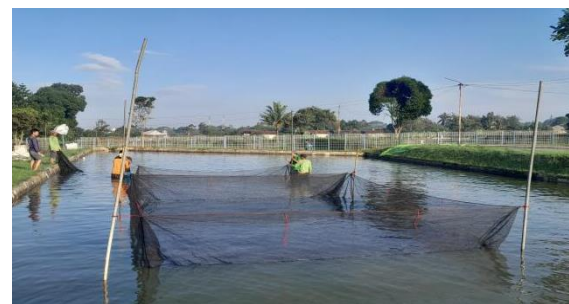
Gambar 3. Kolam pemeliharaan induk.

Pemeliharaan Induk Gurame harus dilakukan dengan baik agar terciptanya benih yang berkualitas. Jenis Induk Gurame yang di budidayakan di BBPBAT Sukabumi adalah jenis Gurame Soang yang memiliki umur rata-rata diatas 2 tahun dengan perkiraan berat 2-5 kg. Pemeliharaan Induk Gurame di BBPBAT Sukabumi dilakukan pada kolam semi intensif yaitu kolam beton dengan alas tanah yang berbentuk persegi panjang dengan luas kolam 465m 2 .