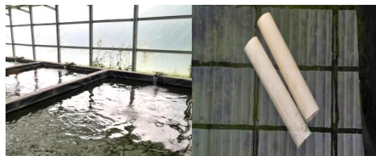
Gambar 7. Bak penetasan telur dan shelter.

dipengaruhi pada saat pemanenan telur, penggunaan aerasi dan juga suhu. Setelah dimasukkan ke dalam bak penetasan, telur membutuhkan waktu 8-10 hari untuk menjadi larva yang sempurna.