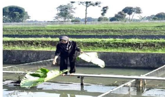
Gambar 5. Pemberian Pakan Daun Sente.

Daun sente mengandung senyawa seperti saponin, flavonoid, dan polifenol yang dapat meningkatkan daya tahan ikan. Pemberian daun sente juga dapat mengurangi kandungan lemak, sehingga tidak memberi tekanan pada kantung telur dan sperma. Senyawa flavonoid dan polifenol memiliki kemampuan untuk menghambat proses oksidasi lemak. Menurut Sulhi et al. (2010) induk yang diberikan pakan dengan campuran ekstrak daun sente dapat menghasilkan fekunditas tertinggi 3.579 butir.