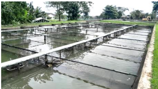
Gambar 1. Kolam Pemijahan Ikan Gurame.

Wadah pemijahan Ikan Gurame di BBPBAT Sukabumi dilakukan pada kolam nomor D.35 yaitu kolam beton dengan dasar tanah. Kolam Pemijahan dibagi menjadi 43 sekat yang terbuat dari besi atau beton yang dibuat seperti persegi dengan memasang jaring nilon dengan net size 3 cm. Pada masing-masing sekat terdapat meja sarang yang terbuat dari pipa paralon yang diikat dengan tali dan juga sosog yang terbuat dari keranjang sampah yang telah diisi ijuk sebagai tempat telur.