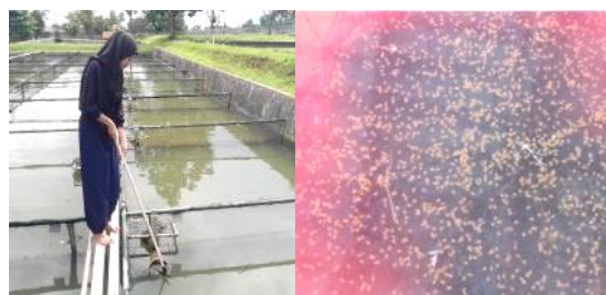
Gambar 6. Pemanenan Telur Ikan Gurame.

Setelah mengetahui ciri-ciri sarang yang berisi telur, selanjutnya dilakukan pemanenan telur dan pemindahan telur yang di panen ke dalam baskom. Panen telur dilakukan secara hati-hati agar telur tidak pecah ketika dalam proses pengangkatan ijuk dalam sosog. Telur yang telah di dapat di hitung jumlah telur terbuahi dan tidak terbuahi secara manual dan dibersihkan terlebih dahulu dari minyak telur Ikan Gurame. Kemudian barulah di masukkan ke dalam kolam penetasan telur yang terdapat di sauna Gurame. Ciri- ciri telur yang terbuahi adalah berwarna kuning bening, sedangkan ciri ciri telur yang tidak terbuahi adalah telur berwarna kuning putih pucat.