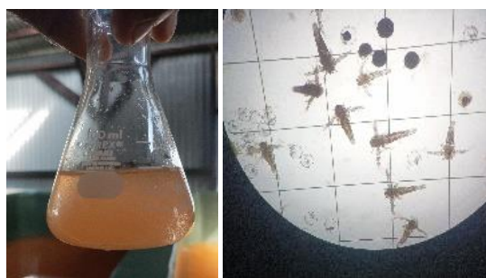
Gambar 5. Artemia sp.

Penggunaan Artemia sp. Sebagai pakan alami pada Udang Vannamei dikarenakan ketersediaan dan karakteristik yang Artemia sp. mudah diterima oleh larva. Artemia sp. diberikan sebagai pakan larva bersamaan dengan algae untuk memperkaya kandungan nutrisi pakan yang diberikan (Martelli et al. , 2020). Kandungan nutrisi yang tinggi pada Artemia sp. sangat dibutuhkan oleh larva udang seperti protein