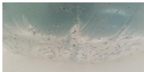
Gambar 2. Benur Udang dalam kantong

Ukuran Benih yang ditebar di PT. Central Proteina Prima yaitu Udang Vannamei ukuran naupli yang dikirim langsung dari beberapa wilayah di Indonesia seperti Situbondo, Jambi, Lampung dan beberapa wilayah lainnya. Naupli yang baru datang direndam dengan air yang sudah ditampung dalam bak yang sudah tercampur oleh iodine selama 5 menit. Hal ini bertujuan untuk menghilangkan penyakit dan bakteri yang berasal dari luar masuk ke dalam kolam.