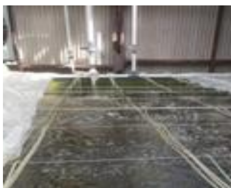
Gambar 4. Pengisian Thalassiosira sp. melalui pipa dari bagian kultur pakan alami.

Thalassiosira sp. memiliki kandungan lipid berdasarkan berat kering sebanyak (52%), (Bhattacharjya et al. , 2020). Pemberian pakan alami Thalassiosira sp. dilakukan mulai dari tahap awal penebaran yaitu tahap naupli dengan pemberian 2 kali sehari. Saat masuk ke tahap Zoea 1-3, pemberian Thalassiosira sp. dilakukan sebanyak 3 kali sehari. Pada tahap mysis 1-3 pemberian Thalassiosira sp. dilakukan sebanyak 3 kali sehari. terakhir pada tahap Post larva (PL) 1 hingga panen pemberian Thalassiosira sp. dilakukan sebanyak 4 kali sehari.