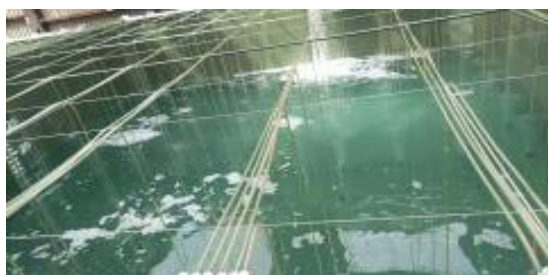
Gambar 1. Pengisian air bak pendederan

Persiapan sebelum penebaran dilakukan tahap penyemprotan fasilitas produksi dan lingkungan hatchery dengan larutan bav-m1 dengan dosis 40 ppm (dilarutkan dengan air tawar dengan perbandingan 25 liter/1ml bav - m10)/ Penyemprotan diulangi lagi setelah 24 jam. Empat hari sebelum stocking naupli, pada pagi hari dilakukan pencucian bak dengan detergen + iodine. Pada siang hari dilakukan penyemprotan virkon sebanyak 1% (10.000 ppm) diamkan hingga kering. Tiga hari sebelum stocking naupli, cuci dan scrub bak dengan menggunakan sanocare pur dosis 1% (10.000 ppm) diamkan hingga kering. Dua jam kemudian bilas fasilitas produksi menggunakan air tawar sekaligus pemasangan selang aerasi yang sudah disterilisasi dengan formalin 1.000 ppm selama 3 jam. Bilas dengan air tawar, gosok dinding bak dengan vitamin C dosis 1.000 ppm untuk menghilangkan residu kaporit / virkon bilas dengan air tawar. Dinding digosok dengan iodine 1.000 ppm. Cuci dan bilas bak, setelah kering semprot dengan Bav-m1 40 ppm, setelah kering minimal 3-4 jam, bak siap digunakan.