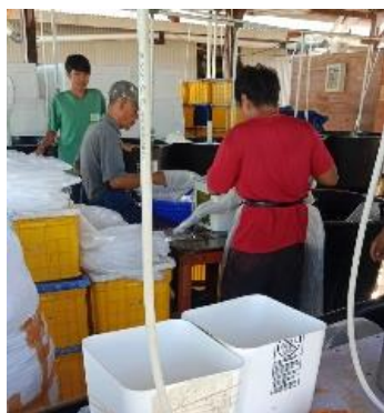
Gambar 8. Proses pemanenan

Pemanenan dilakukan pada udang stadia Post larva (PL) 8 hingga PL 12 sesuai dengan permintaan konsumen. Pada saat pemanenan benur, tahap pertama yang harus dilakukan yaitu penurunan air dengan cara membuka penutup pipa outlet dan menyisakan air sebanyak 20 - 30%, setelah itu saluran outlet dipasang Net panen yang terbuat dari saringan yang digunakan untuk mengumpulkan benur yang keluar dari pipa outlet. Benur sudah di tampung di dalam net panen akan di pindahkan dan di tampung pada ember yang sudah diisi air dan sudah diberi aerasi. Benur yang sudah di tampung akan di tranfer atau diangkat ke dalam bak penampungan. Benur yang sudah ditampung didalam bak penampungan akan dilakukan aklimatisasi selama 5 menit untuk menyesuaikan suhu air yang ada didalam bak.