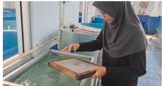
Gambar 4. Penghitungan telur