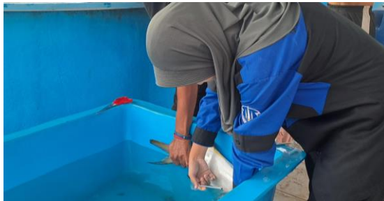
Gambar 2. Proses penyuntikan hormon pada induk Ikan Bawal Bintang.

Selain melakukan manipulasi dalam proses pemijahan bawal bintang juga menggunakan rangsangan hormonal, jenis hormon yang digunakan yaitu hormon HCG ( Human Chroionic Gonadotropine ) dengan dosis 150 IU/kg induk, pemijahan dengan melakukan penyuntikan hormon HCG pada pangkal sirip dada Bawal Bintang dengan dosis 150 IU/kg induk. Rangsangan hormonal dan lingkungan ini bertujuan untuk meningkatkan kualitas telur dan efisiensi pemijahan pada Bawal Bintang serta mengoptimalkan proses pemuliaan dalam rangka peningkatan produk akuakultur yang bernilai ekonomis ini (Putra et al. , 2018; Mulah et al. , 2017). Pemijahan Ikan Bawal Bintang biasanya terjadi pada malam hari saat bulan terang.