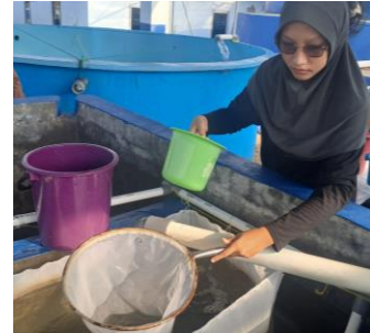
Gambar 3. Egg collector hasil pemijahan Ikan Bawal Bintang