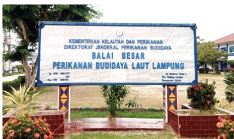
Gambar 1. Balai Besar Perikanan Budidaya Laut (BBPBL), Lampung.

Kegiatan praktik kerja lapangan di laksanakan pada tanggal 1 – 31 Juli 2024, di Balai Besar Perikanan Budidaya Laut (BBPBL) pesawaran, Lampung, yang terletak di Jl. Yos Sudarso, Desa Hanura, Kec. Teluk Pandan, Kab. Pesawaran Lampung 35450. Metode yang digunakan dalam praktik kerja lapangan ini adalah berpartisipasi aktif dalam kegiatan, wawancara, observasi, dan studi pustaka.