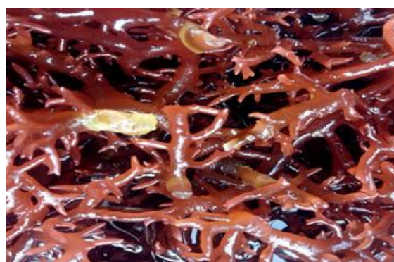
Gambar 1. Penyakit Ice-Ice Rumput Laut Kappaphycus Alvarezii

Infeksi penyakit ice-ice menyebabkan perubahan morfologi pada rumput laut. Proses perubahan ini dimulai dengan hilangnya lendir dari permukaan thalus, yang mengakibatkan permukaan thalus menjadi kasar dan secara bertahap mengalami perubahan warna dari cerah menjadi pucat. Kemudian, muncul bintik atau bercak putih di ujung thalus, yang akhirnya menyebabkan seluruh thalus berubah menjadi putih, seperti yang ditunjukkan pada Gambar 2.