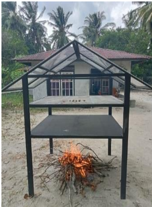
Gambar 4. Pengeringan teripang menggunakan alat pengering hybrid.