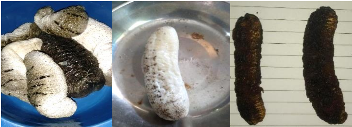
Gambar 3. Tampilan Teripang sebelum dibersihkan (kiri), Teripang setelah dibersihkan (tengah) dan Teripang setelah proses pengeringan (kanan)