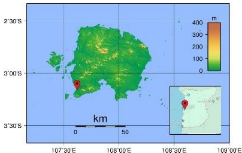
Gambar 1. Lokasi penelitian di Desa Dukong, Kec. Simpang Pesak, Kabupaten Belitung

Masyarakat Desa Dukong di Kabupaten Belitung telah mengembangkan budidaya Teripang. Hasil panennya memerlukan pengeringan untuk memudahkan distribusi dan pemasarannya. Dalam upaya membantu masyarakat Desa Dukong mengolah Teripang kering dilaksanakan riset ini untuk mengkonstruksikan alat pengering hybrid yang aplikatif diterapkan.